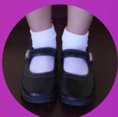
ถุงเท้ายาว