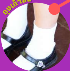
ถุงเท้ายาว