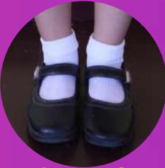
รองเท้ายาว

ใช้ผ้ากรมท่าเนื้อเกลี้ยงตัดแบบ ธรรมดา มีขอบสะเอว ด้านหน้าและ ด้านหลังพับเป็นก้นปลิงด้านละ 3ก้น ความกว้างของก้นที่ซ้อนประมาณ 2.5 - 3.5 เซนติเมตร หักก้นออกด้าน นอกเย็บกับข้างประมาณ 4.7 เซนติเมตร ปลายกระโปรงไม่กว้างหรือ แคบจนเกินไป และชายกระโปรงวัดจาก กลางสะบ้าหัวเข่า ยาวไม่เกิน 5 เซนติเมตร